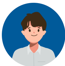
NICOLAS ASSISTANT COMMERCIAL DISPONIBLE 1 À 2 JOURS/SEMAINE